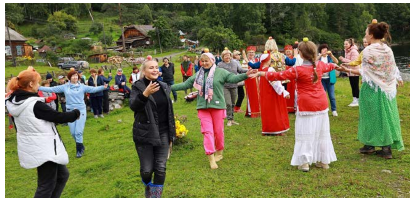
Танец с яблочком, фото А. Лотова