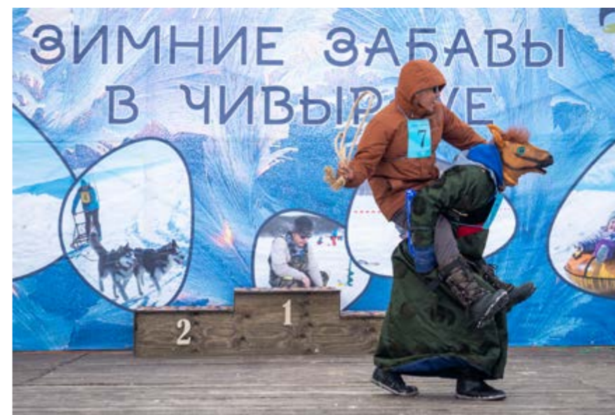
Сани с чудесами

Ежегодно каждое второе воскресенье июля в России отмечается День рыбака. В «Заповедном Подлесье» этот праздник проводят с особым размахом, ведь именно на берегу Байкала очень много тех, кто соединил свою жизнь с этой романтической, но сложной профессией. Для многих местных жителей рыбалка это и спорт, и хобби, и особенное состояние души. А потому День рыбака для нашего края, где испокон веков люди занимались