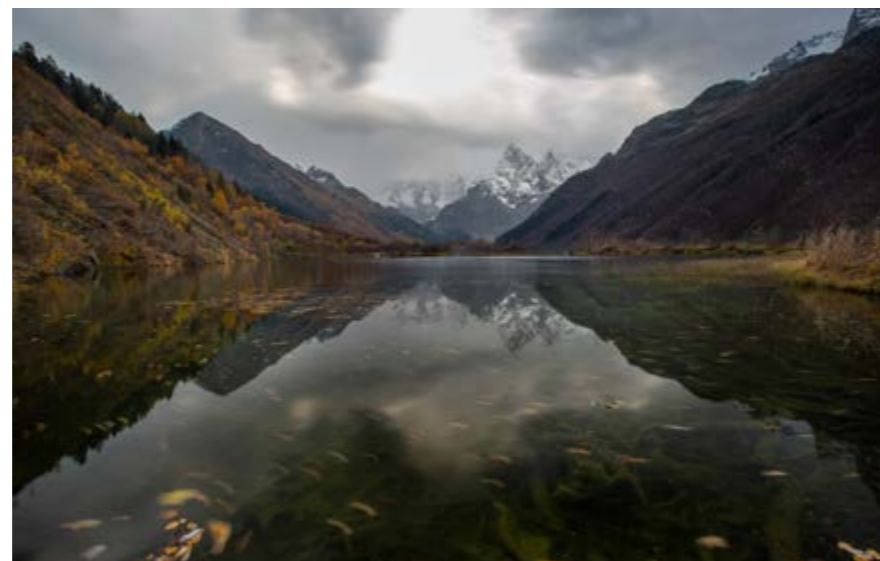
Гоначхир

На сегодняшний день Тебердинский национальный парк активно поддерживает идею развития альпинизма, скалолазания и спортивного туризма. Планируется проведение Всероссийских соревнований по альпинизму на территории парка совместно с Федерацией альпинизма Челябинской области и альпинистским клубом МГТУ им. Г.И.Носова. В рамках сбора предусматривается восхождения на вершины Малый Домбай-Ульген, Зуб Суфруджу, Белалакая.