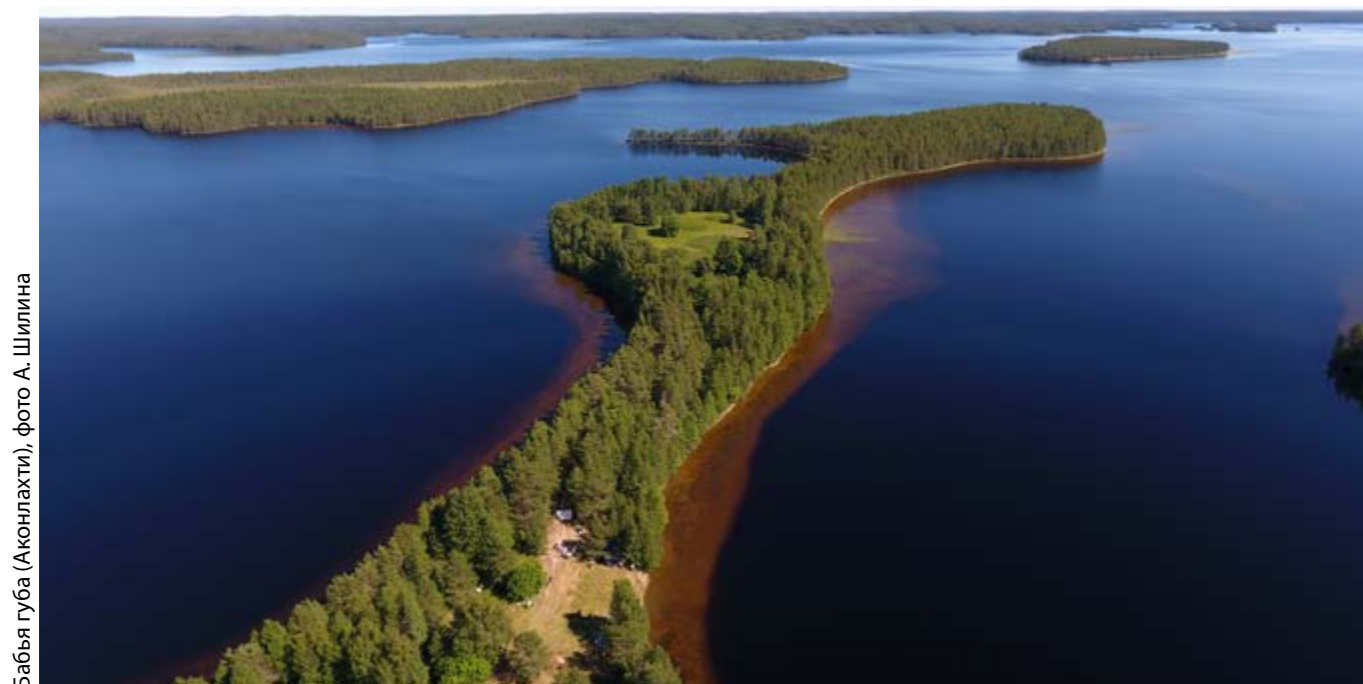
Бабья губа (Аконлахти), фото А. Шилина