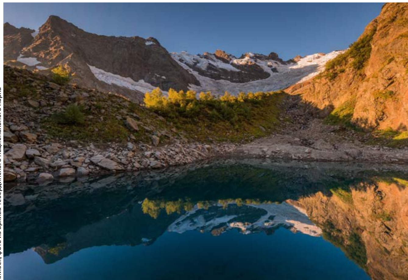
Алибек, фото из архива Тебердинского национального парка