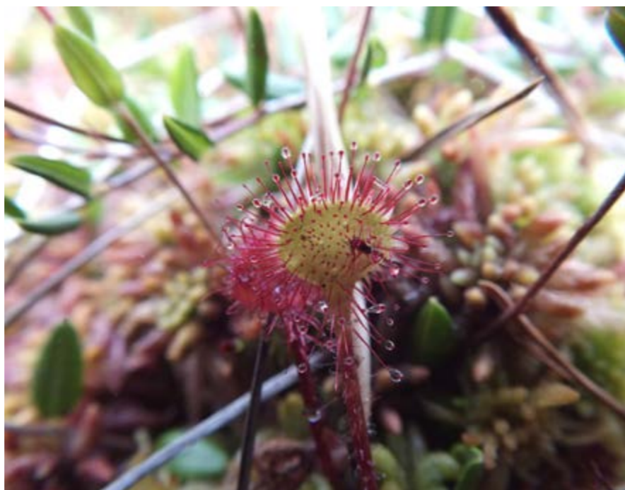
Лист росянки круглолистной с пойманным насекомым

Росянка круглолистная распространена в умеренных и холодных