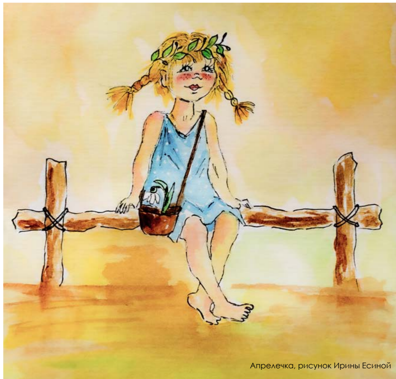
Апрелечка, рисунок Ирины Есиной