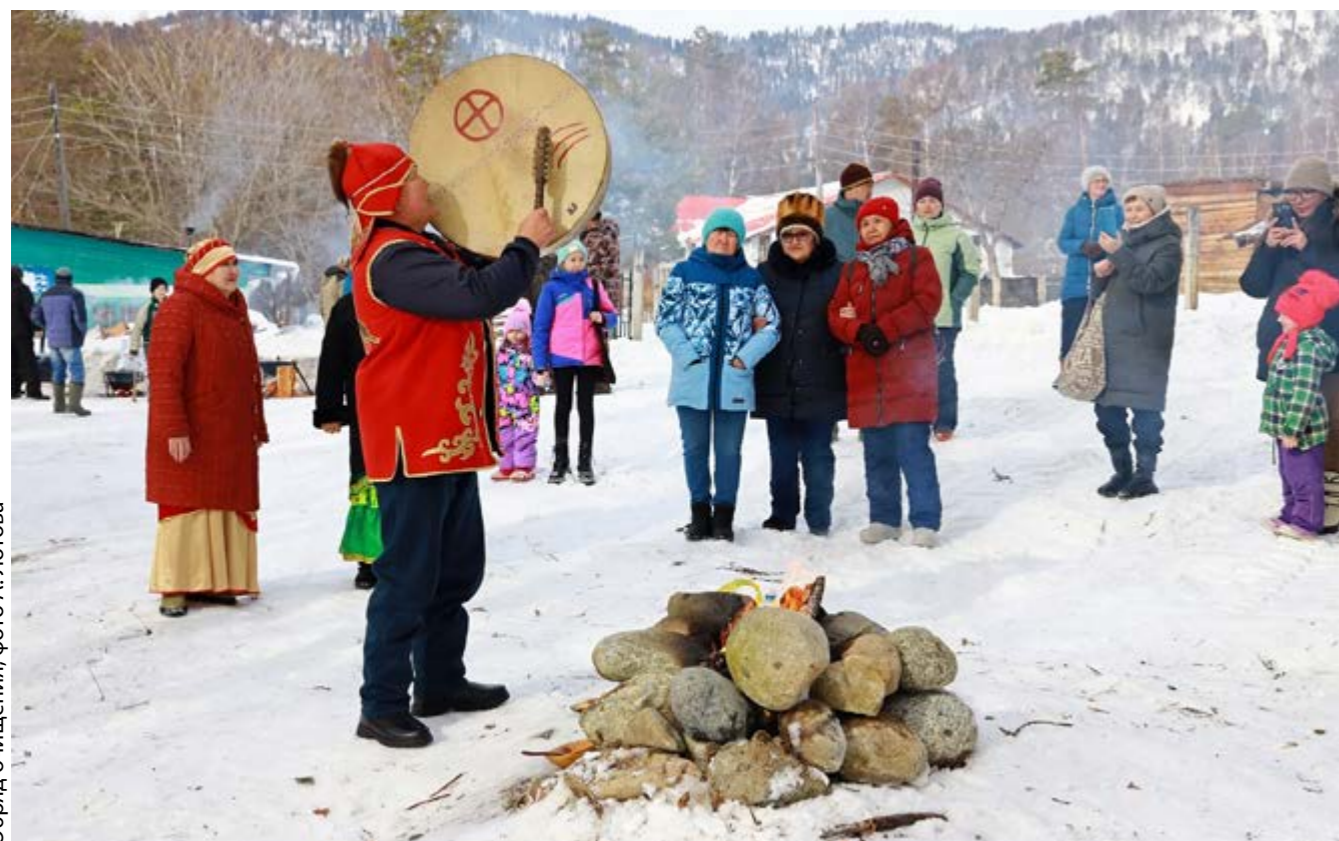
Обряд очищения

Популяризация самобытных национальных обычаев народов Республики Алтай, возрождение традиции проведения народных гуляний, возвращение к глубоким смыслам и подлинным формам народного праздника не только способствует развитию познавательного событийного туризма, но и гармонизирует отношения между народами, опираясь на накопленное культурное наследие, историческую память и разумно используя их для дальнейшего развития межрегионального сотрудничества в современных условиях.