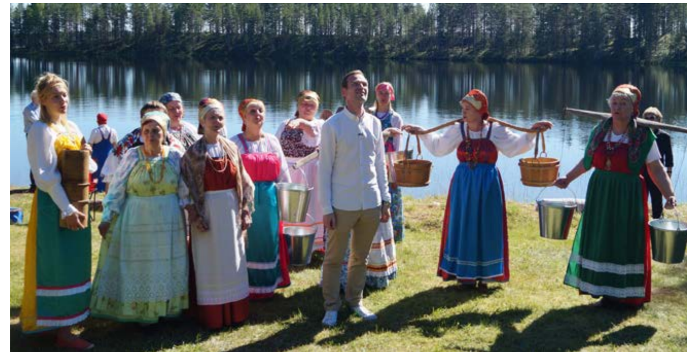
Аконлахти, фото из архива заповедника