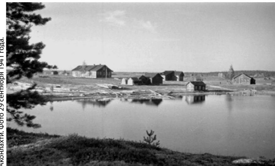
Аконлахти. Фото 29 сентября 1941 года.

В 1983 году территория Аконлахти вошла в состав заповедника «Костомукшский». Сегодня, чтобы побывать здесь, нужно воспользоваться экологическим водным маршрутом заповедника «По рунопевческим местам и старым поселениям озера Каменного». А ещё ежегодно 12 июля, в День Святых Петра и Павла, в Аконлахти проводится традиционный праздник деревни — Петрунпяйва, или День рыбака, на который собираются бывшие жители деревни, их потомки и все, кто интересуется карельской культурой. Традиция была возобновлена в 1993 году по