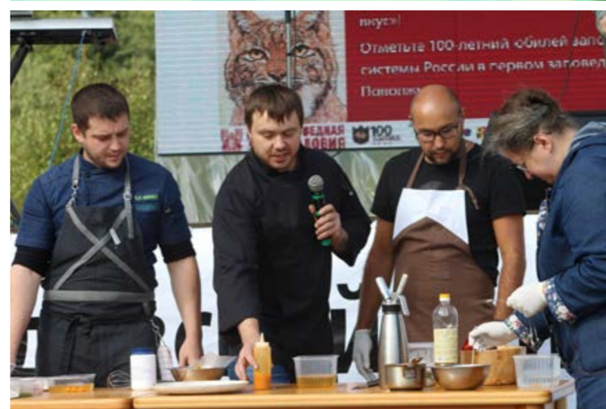
Пятнистый фест: мастер-класс шеф-поваров, кулинарная улица, гости из заповедника «Чёрные земли»

Туристы приезжают за впечатлениями, и, кроме них, получают информацию о заповедной территории и природоохранной деятельности. Часто событийное мероприятие становится началом дружбы между посетителями и заповедником (на-