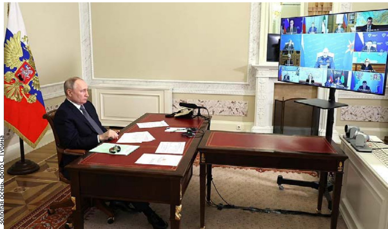
Золотая осень.