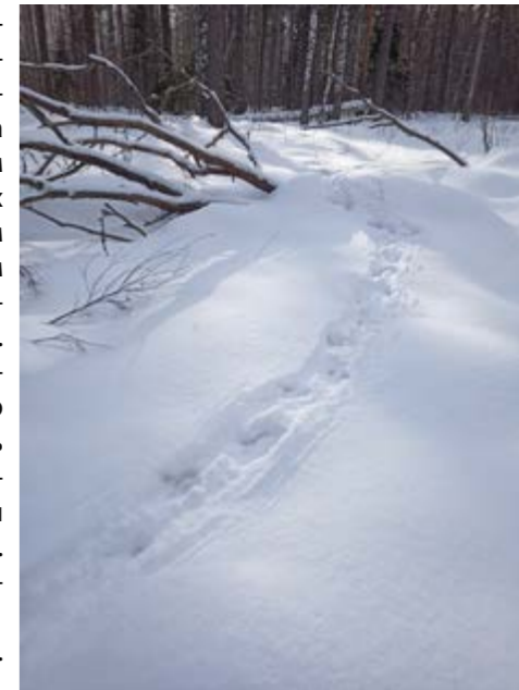
Глухарина «тропа».

млекопитающих, за исключением лесного хоря, который является редким видом на территории Мордовского заповедника, а также 1 вид птиц. По результатам обработки полученных данных было установлено, что в этом году по сравнению с 2022 годом наблюдалось увеличение численности волка, лисицы и белки. Некоторое снижение численности в 2023 году по сравнению с прошлым годом наблюдалось у косули и зайца-беляка. Незначительный спад численности наблюдался у лося и куницы. Численность рыси остаётся стабильной — около 3 особей.