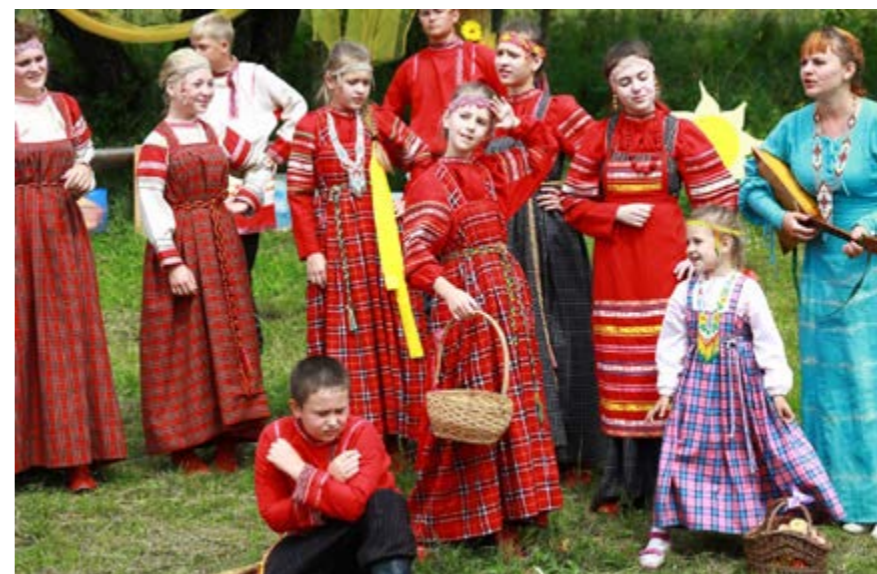
Детский ансамбль «Зёрнышко» с. Артыбаш

Мероприятие было реализовано в 2022 году в восемнадцатый раз, приурочено к православному празднику Преображения Господня, именуемому в народе «Яблочным Спасом». В этот день в Храме Преображения Господня служится водосвятный молебен и Божественная Литургия, по окончании которой организуется Крестный ход и освящается начаток овощей и яблок. Затем для жителей и гостей села Яйлю проводится концертно-хороводная программа на берегу Телецкого озера.