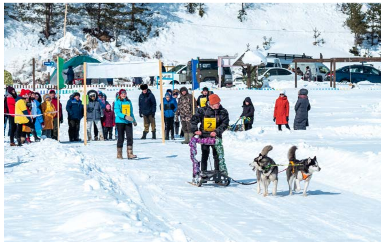
Соревнования Чивыркуйский Дог Спринг

онные местные блюда из байкальской рыбы. Каждый год программа разная, но остаётся широкой. Спортивный дух, творческую фантазию, актёрский талант — это и многое другое демонстрируют участники праздника, не занятые ловлей рыбы.