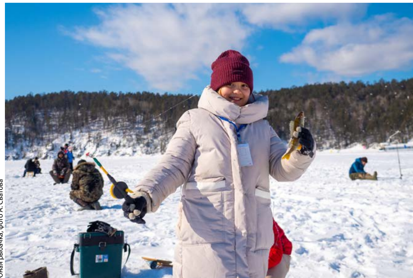
Юная рыбацка

Кроме того, все гости могут посмотреть театрализованные представления, поучаствовать в конкурсах и научиться чему-то новому на тематических мастер-классах. Заодно можно отведать традици-