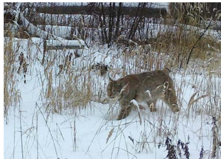
Рысь в Мордовском заповеднике, снимок с фотоловушки

Мягкий, длинный и густой зимний мех у рысей в различных областях их ареала имеет разную окраску: пельно-голубую, палево-дымчатую, серо-бурую, красно-рыжую. Почти всегда мех испещрён тёмными пятнами, крупными на спине и боках,